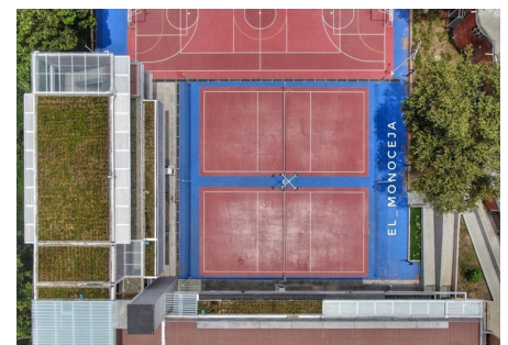
La idea es una vivienda ecológica y sostenible.