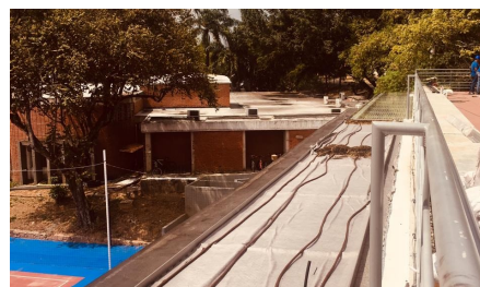
Instalación del riego por goteo.