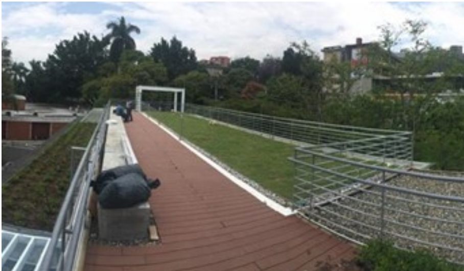
El Centro Deportivo Universitario de la Universidad del Valle.