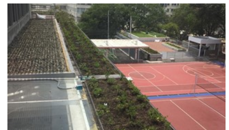
La vegetación usada se integró muy bien en el entorno natural.