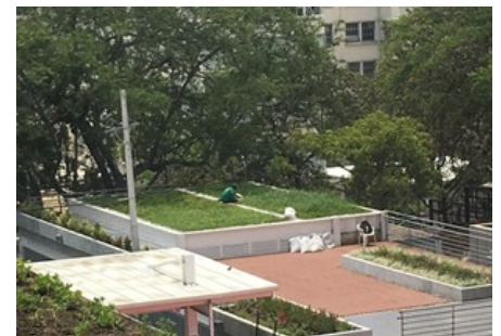
Aparte del carácter deportivo instalaron también vegetadas para crear un lugar para el "bienestar".

esparcimiento verdes en diferentes pisos del edificio manteniendo el respeto y la integración con el entorno natural inmediato. Usando el sistema de cubiertas verdes con base en el sistema de drenaje Floradrain® FD 25-E con sistema de riego por goteo y diferente vegetación de acuerdo a la localización de la cubierta como Césped y Coberturas.