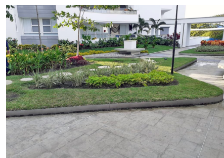
También se crearon oportunidades para los residentes para sentarse, correr y relajarse.

permitiendo el recreo, encuentro y esparcimiento pensado para todos los habitantes de los apartamentos.