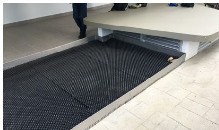
Instalación del Floradrain FD 25-E sobre la manta protectora y retenedora SSM 45.