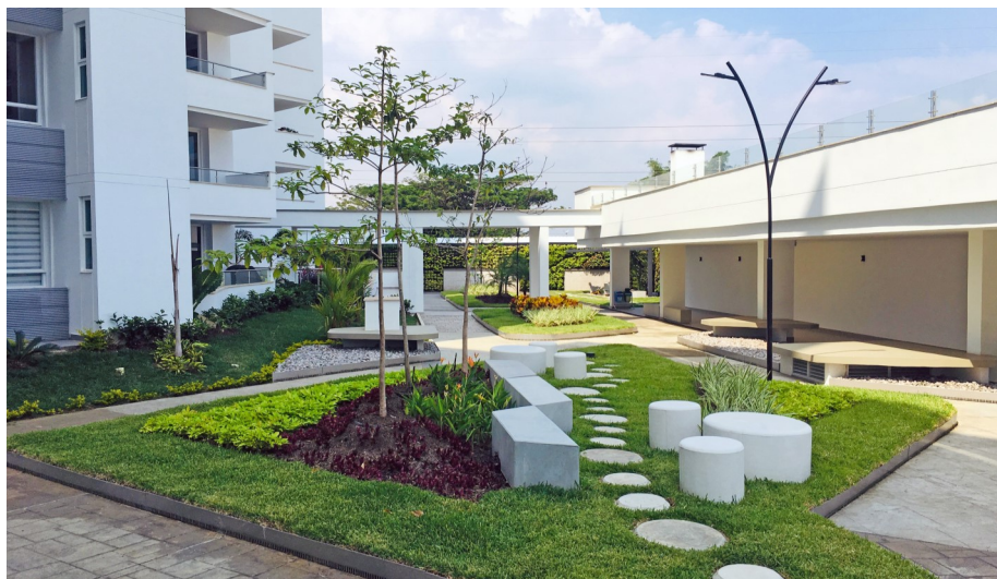
Un jardín en la azotea en la parte superior de un garaje subterráneo entre edificios residenciales.