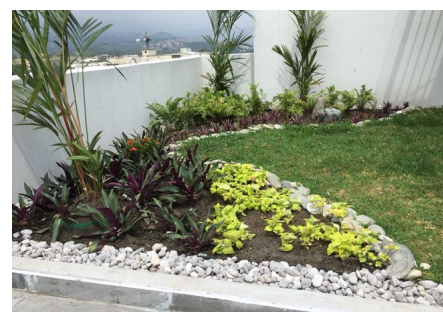
Una selección de plantas adaptadas al entorno hace que la imagen sea perfecta.

Forjado con impermeabilización antirrtaZ