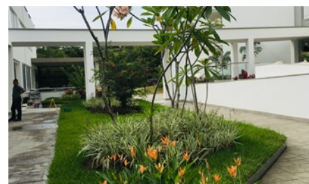
Poco después de la instalación.