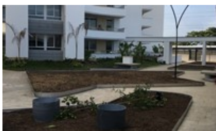
La plantación de la vegetación ha comenzado.