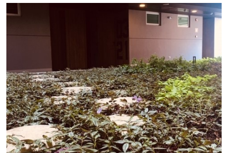
Para facilitar el mantenimiento, se colocan cubiertas de suelo.