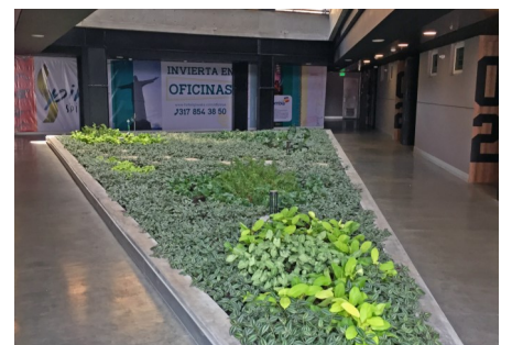
Se ha creado una hermosa área verde en el patio.