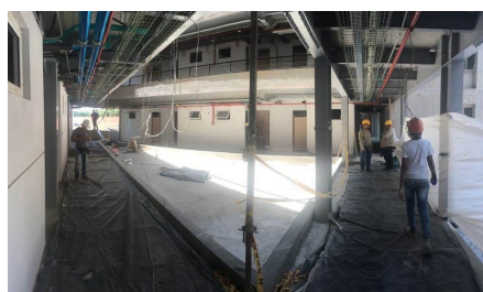
... durante la instalación ...