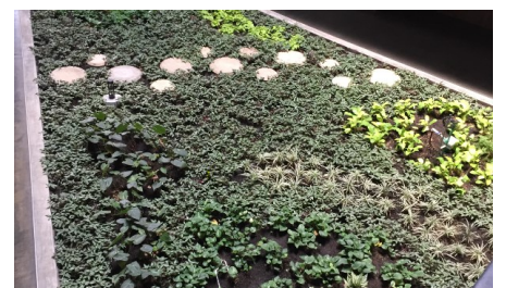
... y la vista después ...