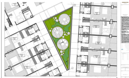
Planificación de un centro de atención ...