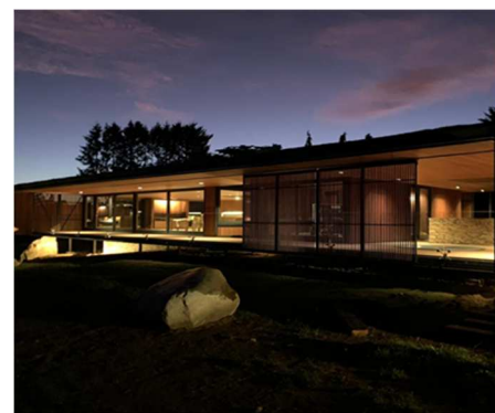
La casa también ofrece una imagen maravillosa en la noche.