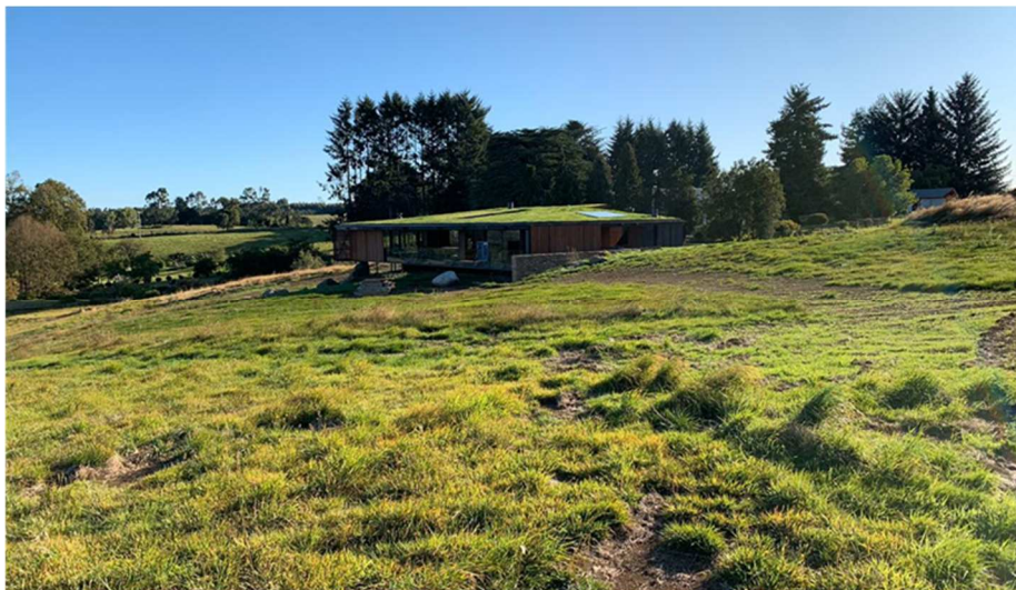
Una simple cubierta verde, pero "respira" paz cuando se la observa...