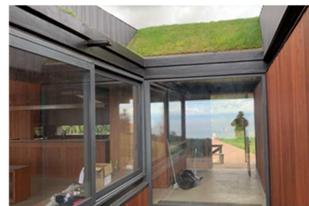
Una vista a través de la casa hacia el lago ...