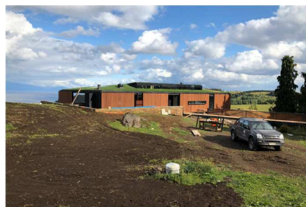
Aún no se ha terminado de construir, pero ya se puede sentir la paz y la tranquilidad.