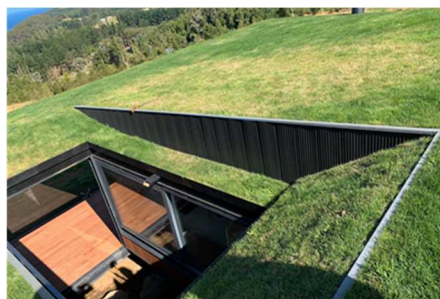
Una vista de la casa desde arriba hacia la sala de estar "escondida".